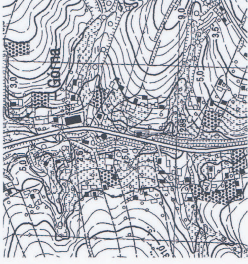
SZKIC ORIENTACYJNY SKALA 1:10000